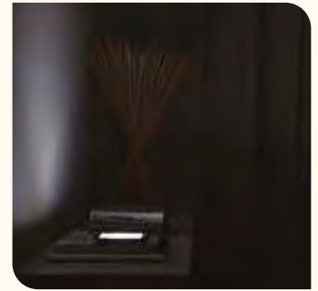
"Riflessi domestici" Marostica Fotografia 1979

riassumere in modo iconico eventi complessi e cruciali che segnano un momento di rottura e modificano la storia. Per citare qualche esempio: L'uomo che cade di Richard Drew che mostra il volo di un uomo che si è gettato da una delle Torri Gemelle, o Tank Man di Jeff Widener, scattata nel 1989 in piazza Tienanmen, in cui uno studente protesta di fronte ai carri armati dell'esercito