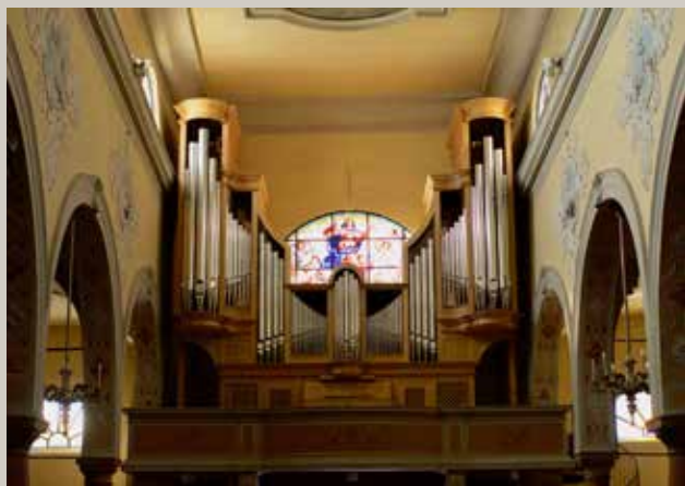
L'organo Zeni della Chiesa di Santa Maria Assunta.

È organista onorario del Duomo di San Lorenzo in Abano Terme (Padova).